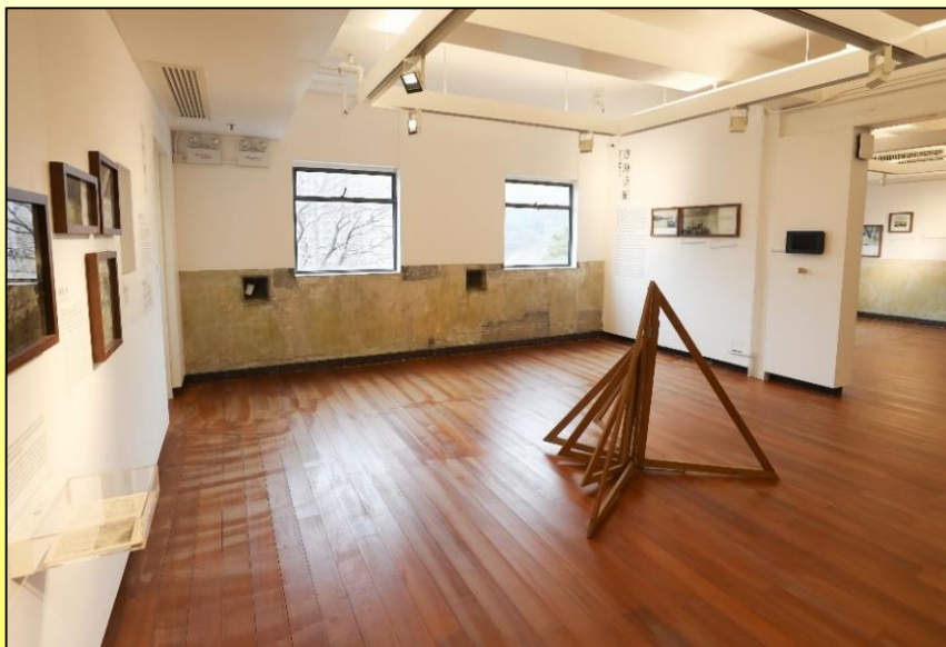
前調景嶺警署的內部 Interior of former Rennie's Mill Police Station 2026