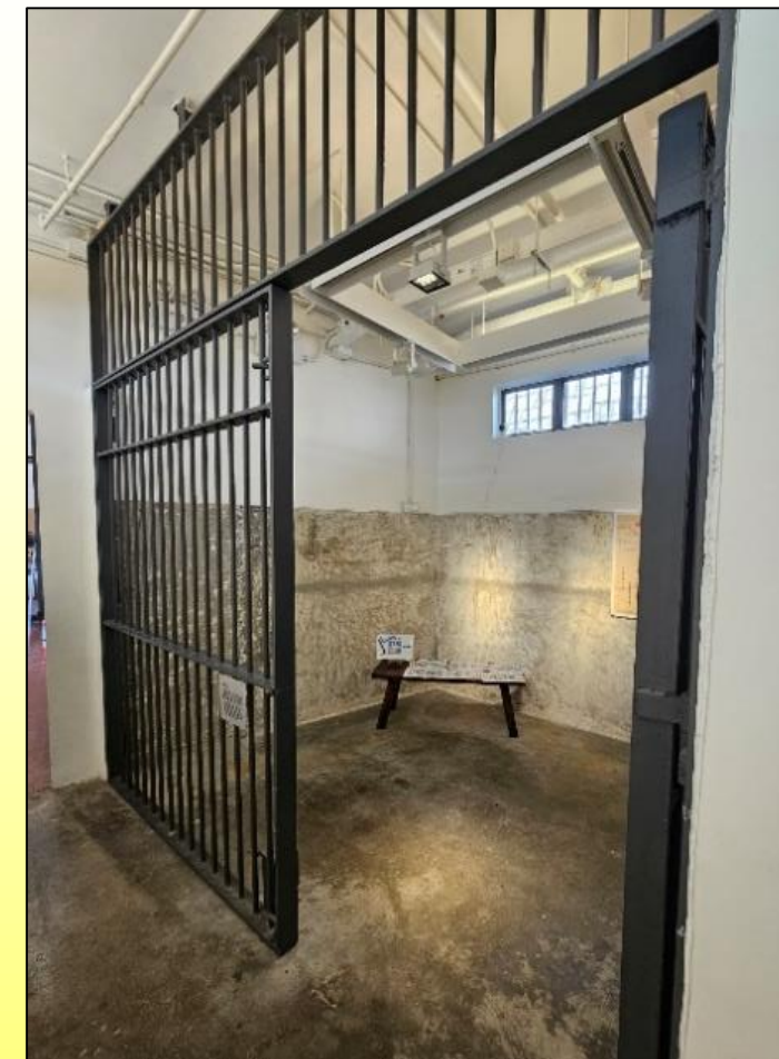
重建的羈留室 Reconstructed detention cell 2026