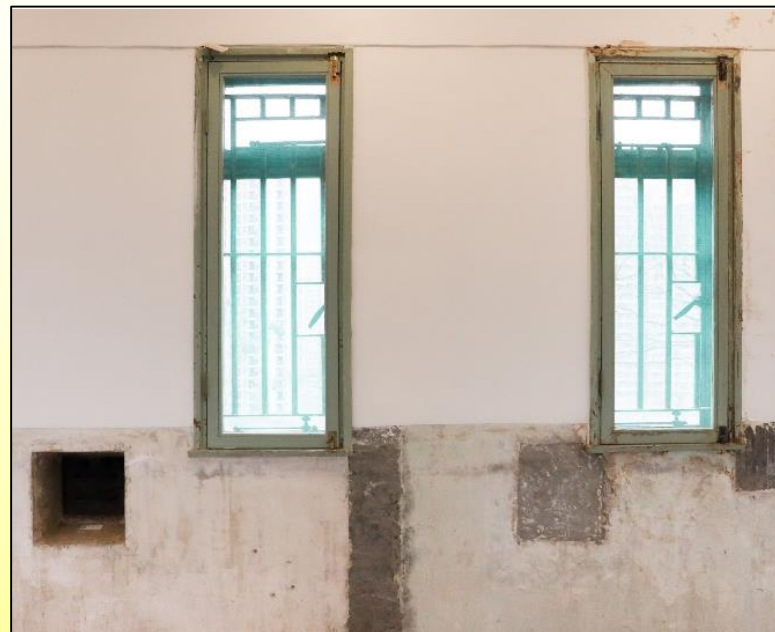
裝有木框和金屬窗花的舊窗被保留 Old windows, fitted with wooden frames and metal grilles preserved 2026