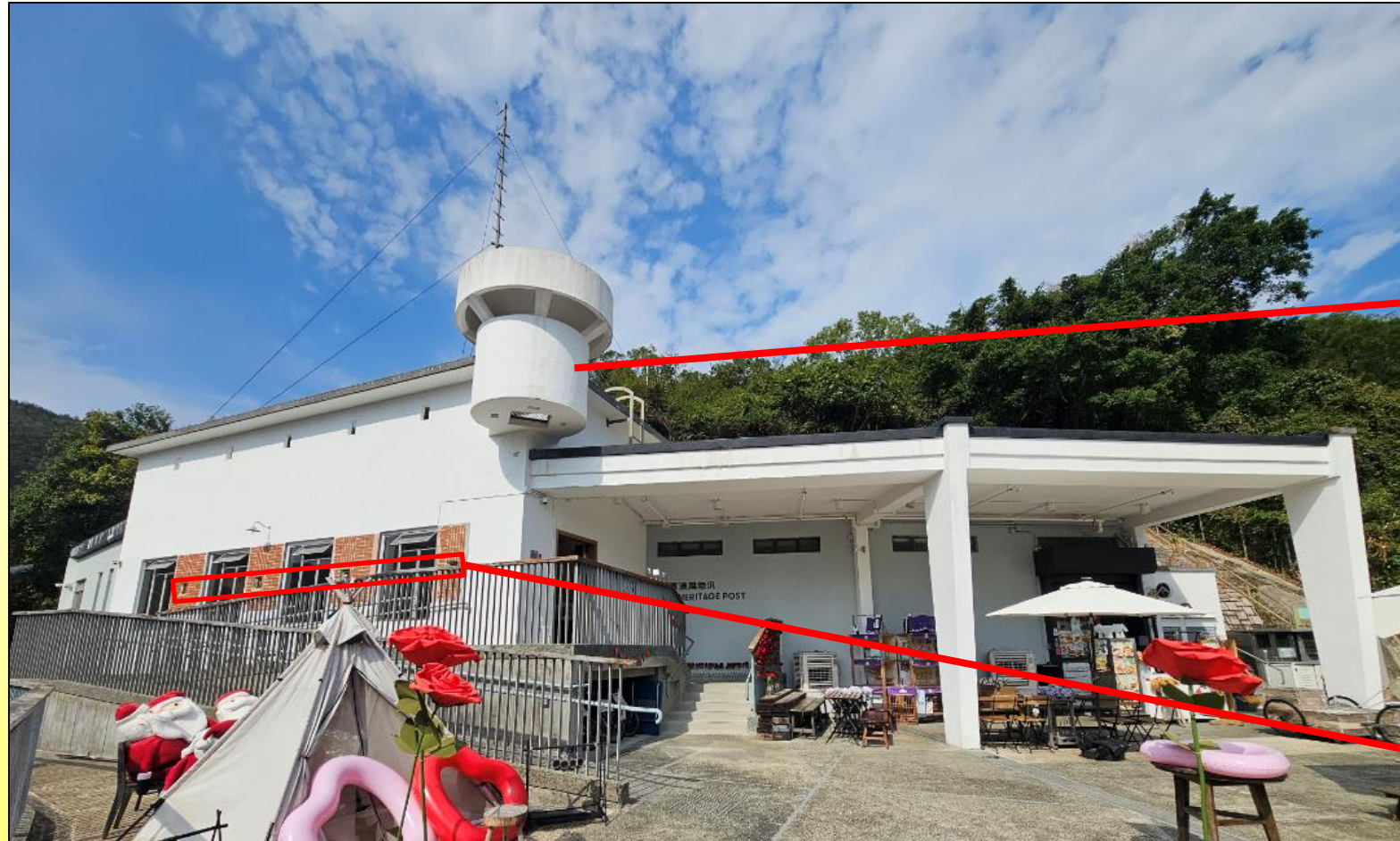
前調景嶺警署的外部 Exterior of former Rennie's Mill Police Station 2026

Former Rennie's Mill Police Station, No. 160 Po Lam Road South, Tseung Kwan O, New Territories