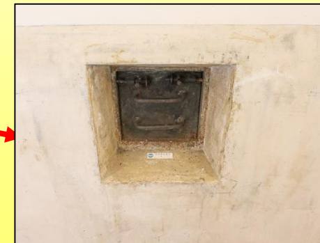
方形槍孔 Square firing aperture